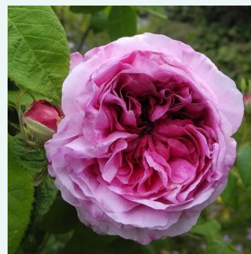
Président de Sèze