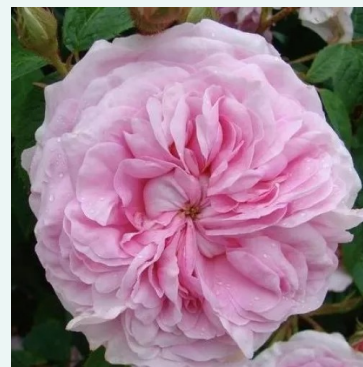
New Maiden Blush

rosa - historische, perpetual-hybrid-rose 110-160 cm sehr stark duftende, schon aus großer Entfernung wahrnehmbare rose - intensiv süß, teeartig, rosenhaft Henry Bennett