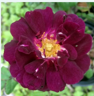
Nuits de Young

rosa - historisch, alba-rose 140-200 cm sehr stark, lang anhaltend duftende rose - duftbeschreibung nicht verfügbar James Booth