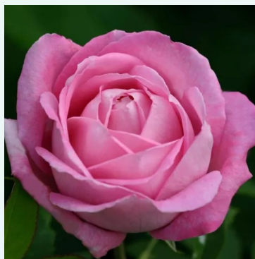
Mrs. John Laing