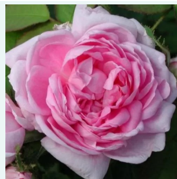
Marie de Blois

hell-rosa - historisch, alba-rose 120-190 cm sehr stark duftende, von weitem wahrnehmbare rose - klassisch, rosenartig -